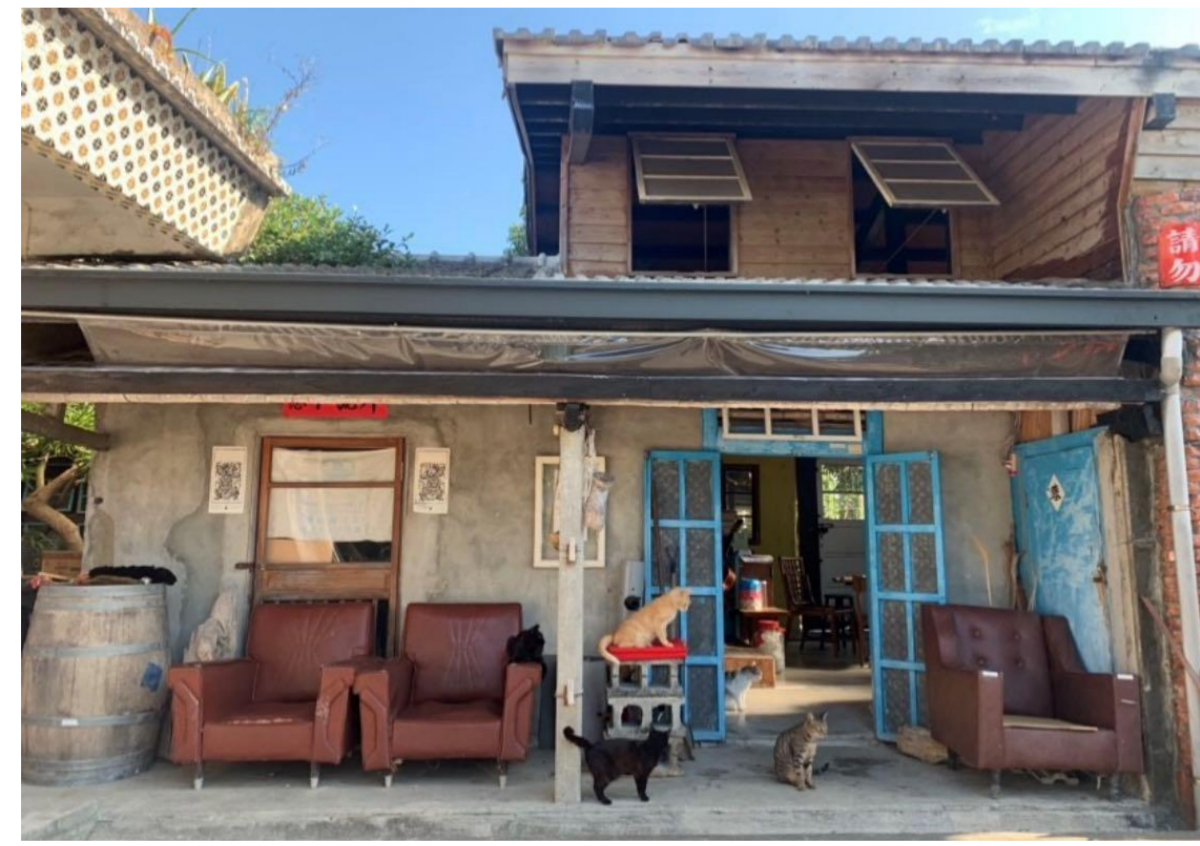
圖一 (P01; P01W)