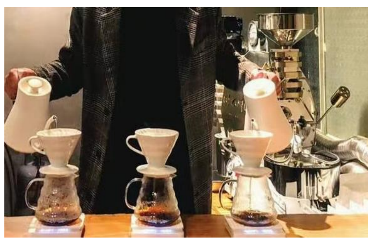
圖二 (P03)：「xxx都誇我一次可以同時沖3壺咖啡。」

「調酒...算是我的一個興趣吧，幾天不調也會手癢。」 (P01, 男, 民宿) 「開一間咖啡廳推廣精品咖啡也是我的夢想。」 (P03, 男, 自家烘焙咖啡)